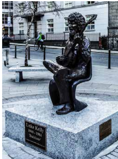
Luke-Kelly-Statue in der South King Street

Achim Reichel bei der Ruth-Verleihung 2007