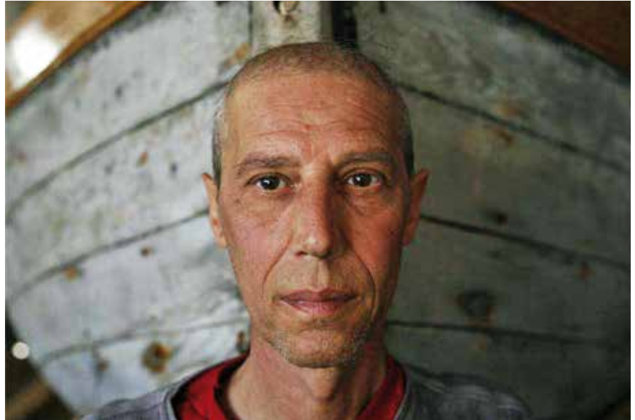
Andrea Parodi (1955-2006)