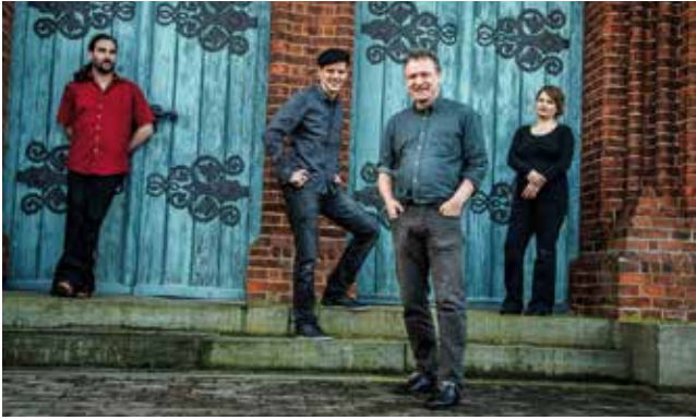
Die Grenzgänger