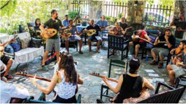
Music Village 2018