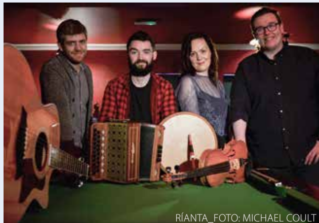
RÍANTA_FOTO: MICHAEL COULT