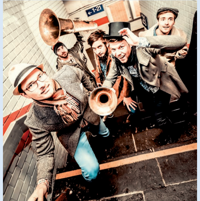
MAIK MONDIAL_FOTO: ANDOZ KRISHNADAS