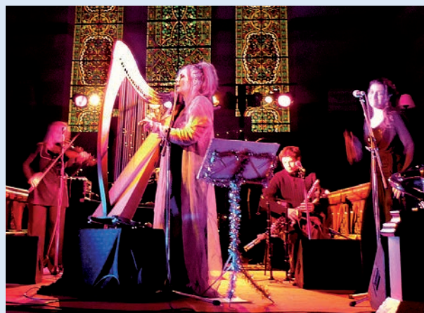
MOYA BRENNAN & BAND_FOTO: ARCHIV