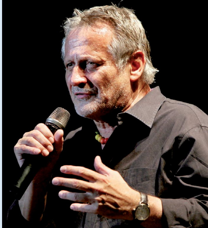
KONSTANTIN WECKER