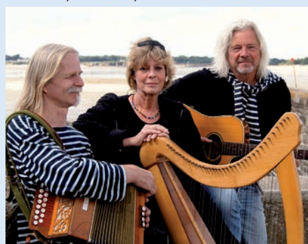
AN ERMINIG

zeichen geworden ist, an der Tagesordnung. Mittlerweile gelten sie als eine der wegweisenden neuen Folkgruppen Irlands. Ihr Programm beinhaltet eine große Bandbreite aus New Folk, Bluegrass, Pop, Irish Tradition, Balladen, aber auch Anleihen bei den swingenden Andrew